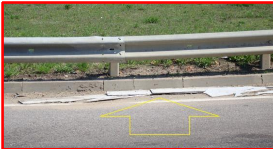
Наличие мусора на осевых полосах и полосах безопасности обозначенных линиями горизонтальной дорожной разметки