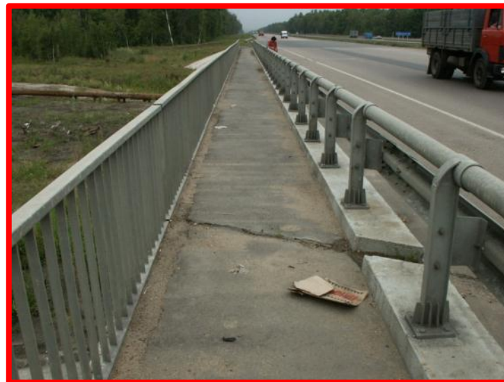
Не очищенные от мусора тротуары мостовых сооружений