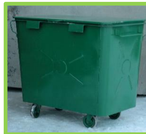
Переполненные контейнеры для сбора мусора на остановках общественного транспорта, площадках отдыха и стоянках транспортных средств