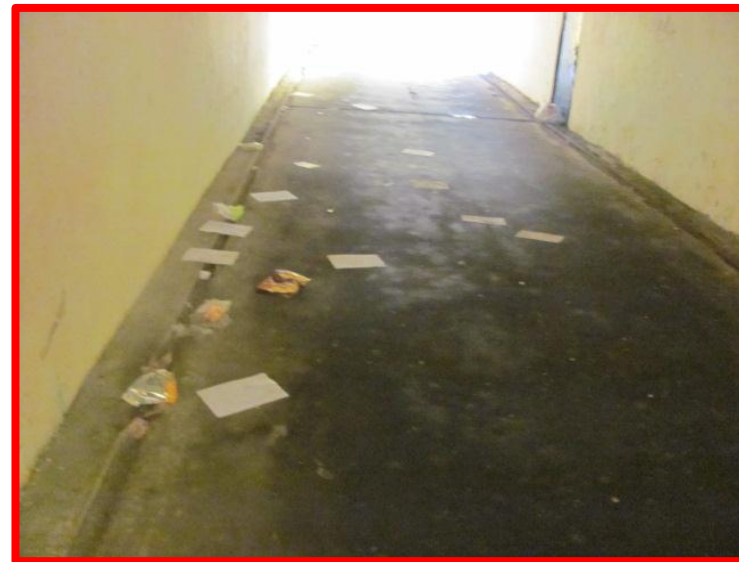
Наличие мусора в подземных и надземных пешеходных переходах