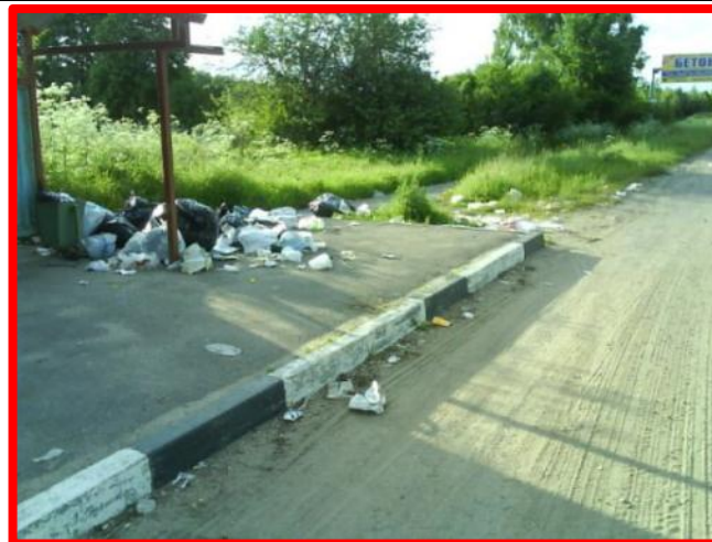
Наличие мусора на остановках общественного транспорта, площадках отдыха и стоянках транспортных средств