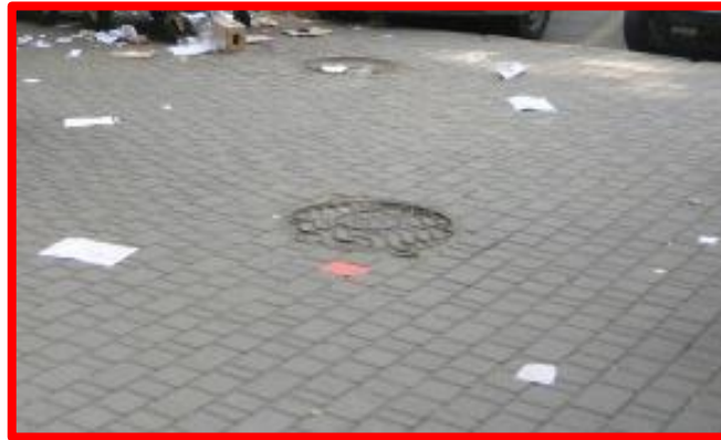
Не очищенные от мусора тротуары