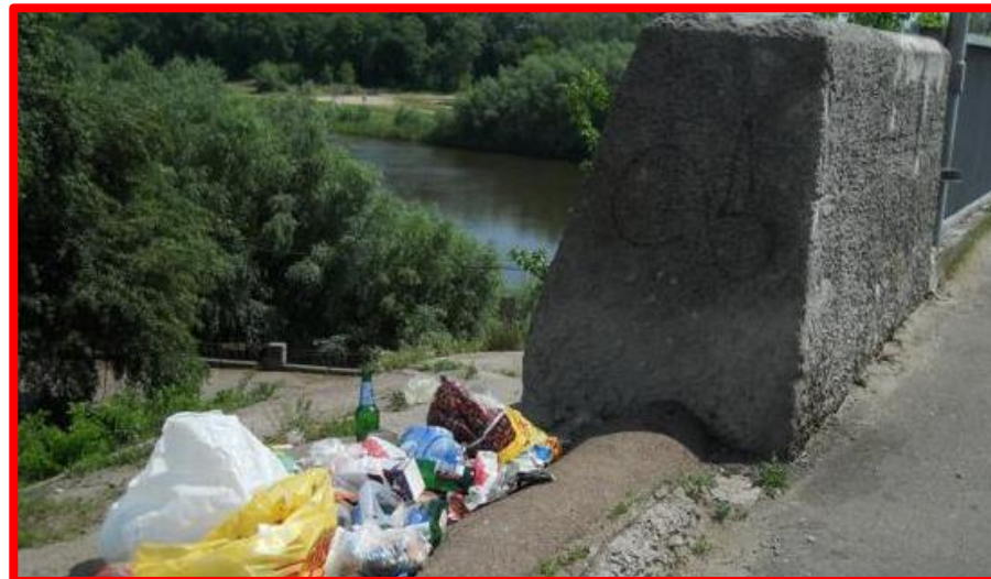
Не очищены конуса от мусора