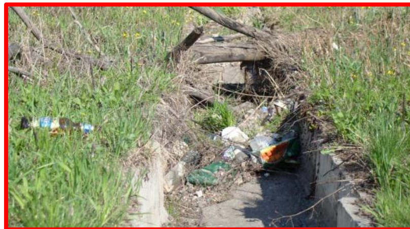
Не очищенная от мусора система водоотвода (водоотводные, прикромочные лотки, быстROTOки, нагорные канавы и т.д.)