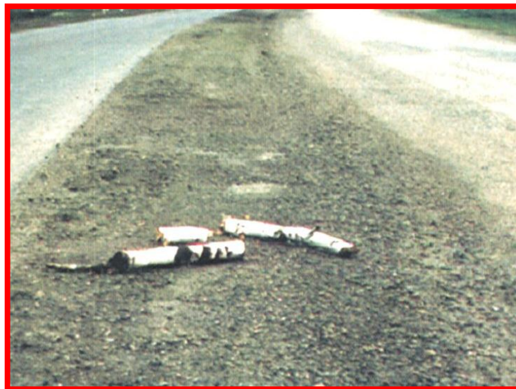
Наличие посторонних предметов на обочинах и разделительной полосе влияющих на безопасность