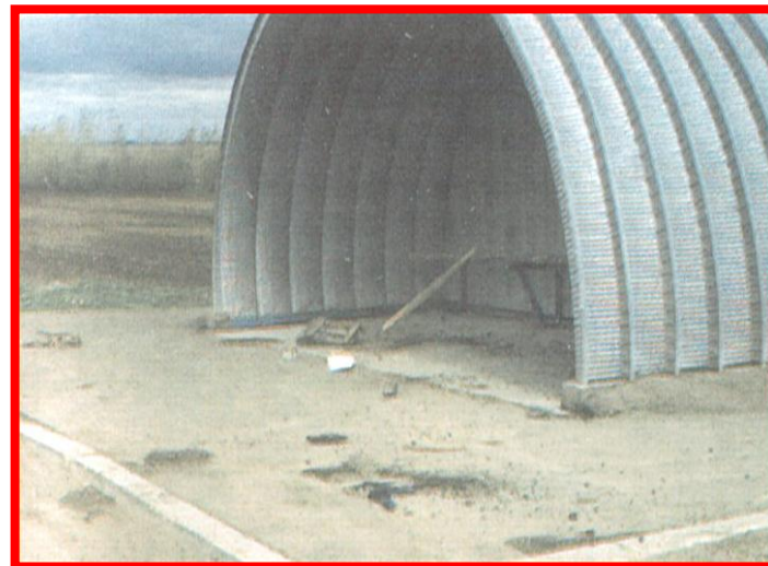
Наличие мусора на остановках общественного транспорта, площадках отдыха и стоянках транспортных средств