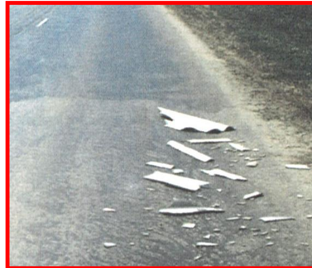
Наличие посторонних предметов на проезжей части