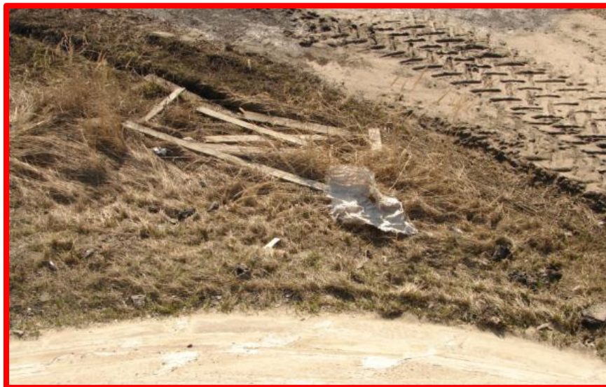
Не очищена подмостовая зона от посторонних предметов