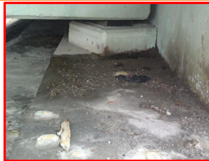
Не очищена верхняя площадка опор от мусора