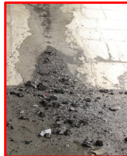
Не очищенная от мусора система водоотвода (водоотводные лотки, гасители и т.д.)